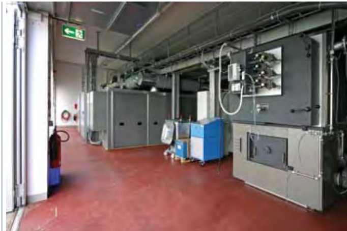
Pellets-Heizkessel mit BHKW und Absorptionskältemaschinen