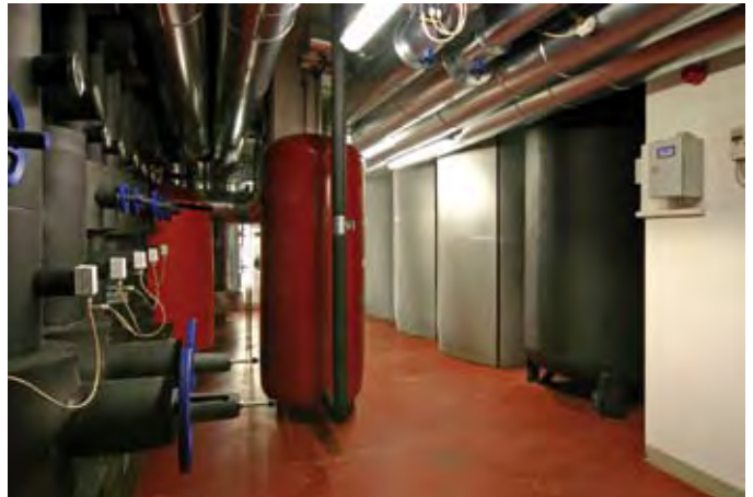
Kälteverteiler (links) und Wärme- bzw. Kälte-Pufferspeicher (rechts)