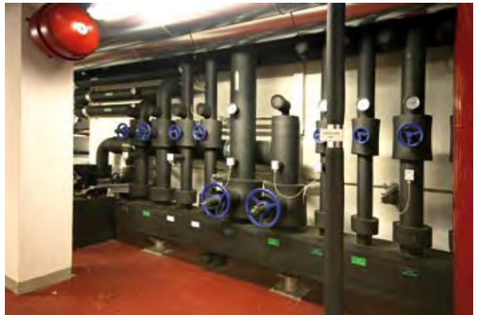
Zur Deckung des steigenden Kältebedarfs ist eine 5. AKM bereits eingepflanzt