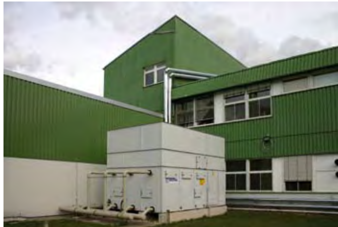
Ab 5 °C Außentemperatur arbeitet der Kühlturm im Freikühlmodus