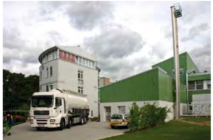
Pro Jahr werden rund 390 t Pellets und 160 000 l Rapsöl benötigt