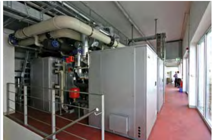
Die vier Yazaki-Absorptionskältemaschinen arbeiten auffällig leise

Vereinbarung wurde mit dem Hersteller der Teppichböden getroffen. Auch bei der Energieversorgung ging Bionorica neue Wege. Das neue Verwaltungsgebäude sollte mindestens so viel Energie produzieren, wie es selbst konsumiert. Die Energie sollte einerseits durch ein riesiges Sonnensegel aus Photovoltaik-Modulen auf dem Dach sowie die Teilbestückung der Fassade gewonnen werden. Für den Energiebedarf des neuen Verwaltungsgebäudes war ein BHKW (20 kW el ) vorgesehen, das mit Pflanzenöl angetrieben werden sollte. Als Backup war ein Pellets-Heizkessel (60 kW) vorgesehen. Die notwendige Klimakälte für die Chefetage, Büros und Konferenzräume (Klimatisierung der Räume über aktive Kühlbalken, Typ Baltic von Swegon) sollte eine mit BHKW-Abwärme angetriebene Absorptionskältemaschine (AKM) liefern, unterstützt durch eine kleine Kompressionskältemaschine für die Lastspitzen.