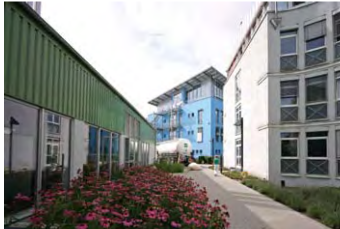
Das neue Bionorica Verwaltungsgebäude (Mitte), links die Energiezentrale