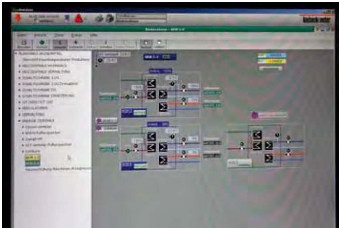
Pelletskessel, BHKW und AKM sind über Modbus auf die GLT angeschaltet