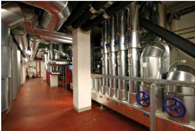
Heizverteiler für Verwaltungsgebäude und Produktion